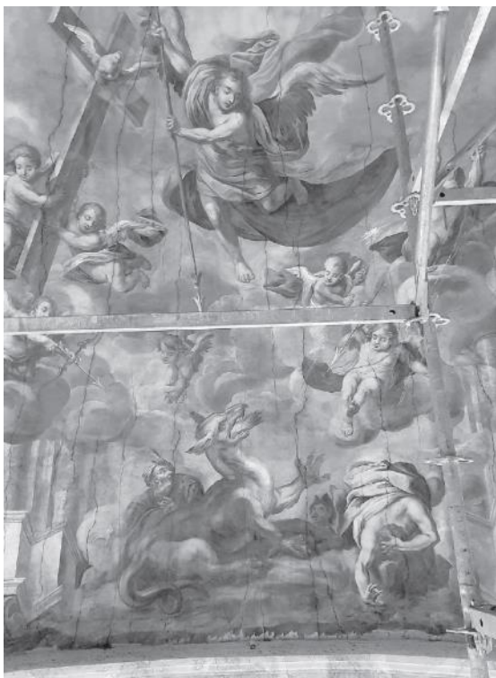
Nástropní freska kostela sv. Markéty v Jaroměřicích, detail boje archanděla Michaela s drakem.

„Pro tesaře jsme připravili terén tak, aby omítky v kopuli už nebyly. Začínáme s čištěním a transfery (přenosy) se upravují tak, aby se omítky mohly vrátit zpátky. Je to metoda, kdy