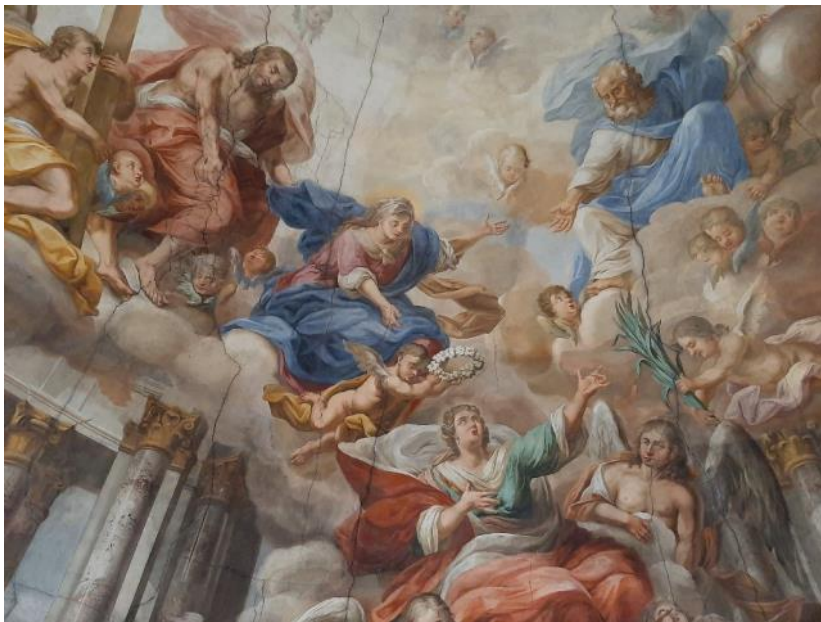
Nástrovní freska kostela sv. Markěty v Jaroměřicích nad Rokytnou. V podání malíře Teppera je vznešená Markéta zachycena na kupoli kostela v červeno-zeleném šatu, ozdobená šňůrou perel a perlovými náušnicemi, na oblaku unášena anděly do nebe. Jedná se o zobrazení apoteózy, tedy přeměnění bytosti lidské do podoby božské.

„Omítky vykazují nejen vysokou pevnost, ale prozrazují také italský způsob používaný už od dob římského cementu. Italové nikdy nepřestali do omítek používat hydraulická aditiva. Je zajímavé, že v Itálii se používaly sedimenty z města Pozzuoli na úbočí Vesuvu, te-