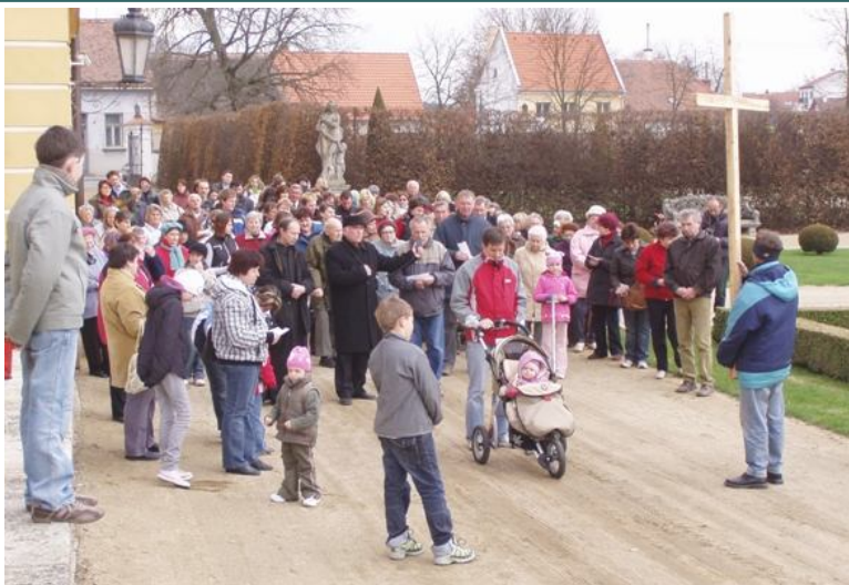
KŘÍŽOVÁ CESTA NA VELKÝ PÁTEK V PARKU