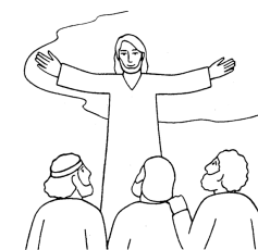
NANEBEVSTOUPENÍ Luk. 24, 50-53