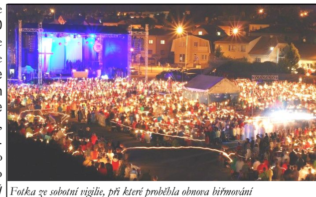
Fotka ze sobotní vigílie, při které proběhla obnova biřmování

Ve Žďáře se sešlo na 6000 mladých lidí, kteří se přijeli setkat se sebou navzájem, ale především s živým Kristem, který je uprostřed nás, uprostřed církve. Věřím, že stejně jako pro mě to byl i pro ostatní silný duchovní zážitek,